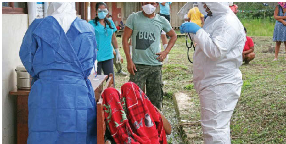
Atención de salud en la Comunidad de Yutupis

“Hay que tener mucho cuidado. Esta enfermedad está quitando la vida a muchas personas”, advierte.