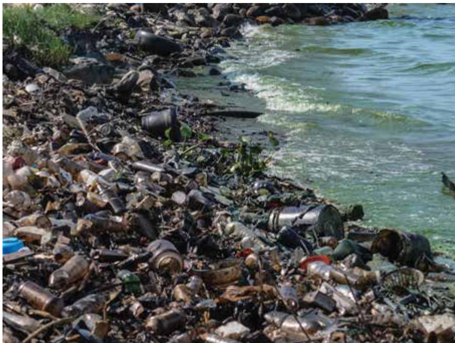
La contaminación de los mares y de las playas que los circundan es cada vez peor, la basura que diariamente se arroja a estos desborda la imaginación que no alcanza a describir el daño letal que esto produce al planeta mismo.