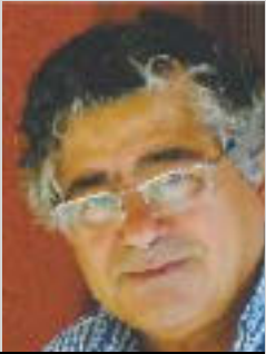
Por: Pepe Mejía, desde Madrid

Un joven negro fue vejado, insultado y agredido en Manresa, 16 guardias civiles han sido absueltos de su presunta implicación en la muerte de 15 migrantes que murieron ahogados después de disparar pelotas