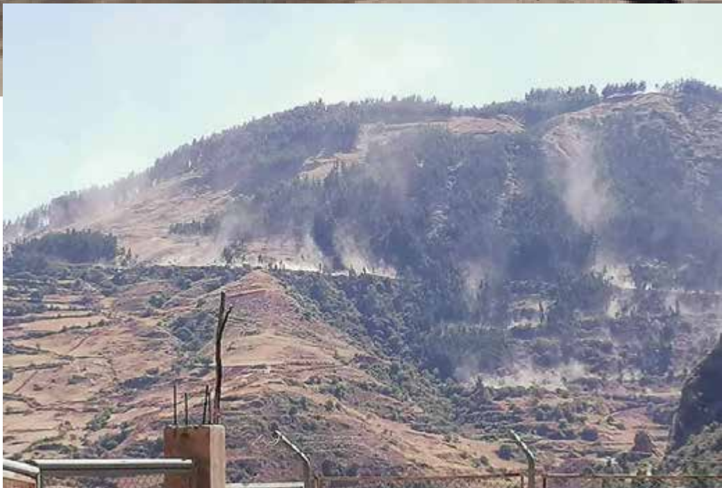
Una explosión levanta humo y polvo en Paruro afectando la vida de seres humanos, depredando la atmósfera, y las tierras de cultivo.