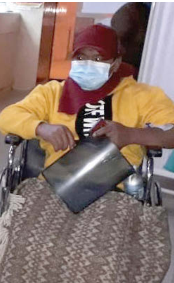
Trabajadores de Espinar, heridos de bala, ahora ellos enfrentan las amenazas de un sistema que, como siempre, acusa de criminales a las víctimas.