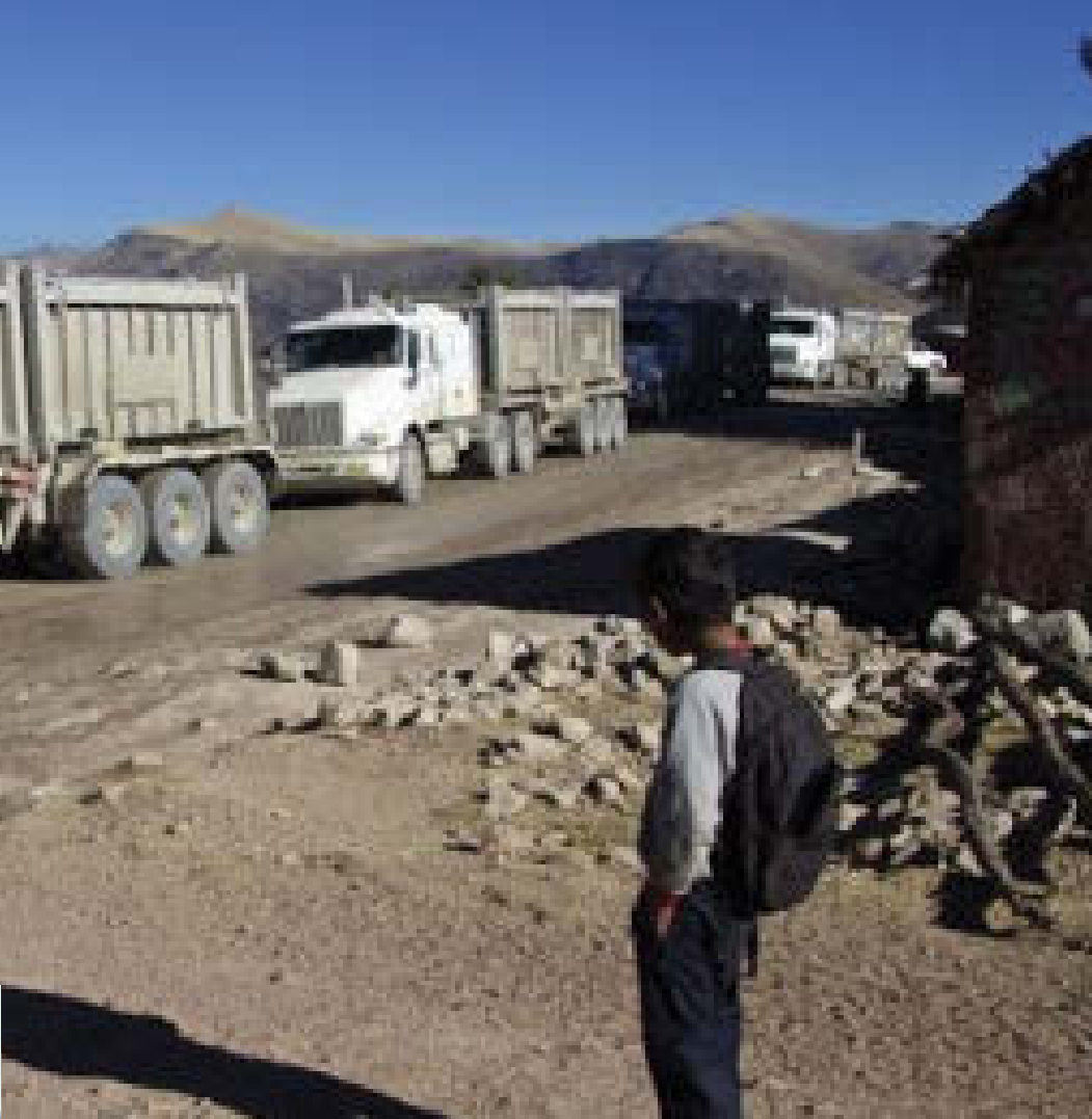
Un convoy de camiones se dirigen a Las Bambas burlando las demandas populares